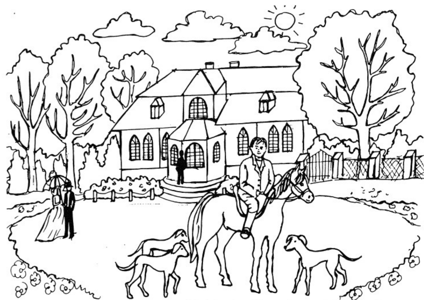
W latach 30. XX w. w Potoku w Rakszawie był dworek w stylu romantyczno-gotyckim i psiarnia dla rasowych psów myśliwskich.