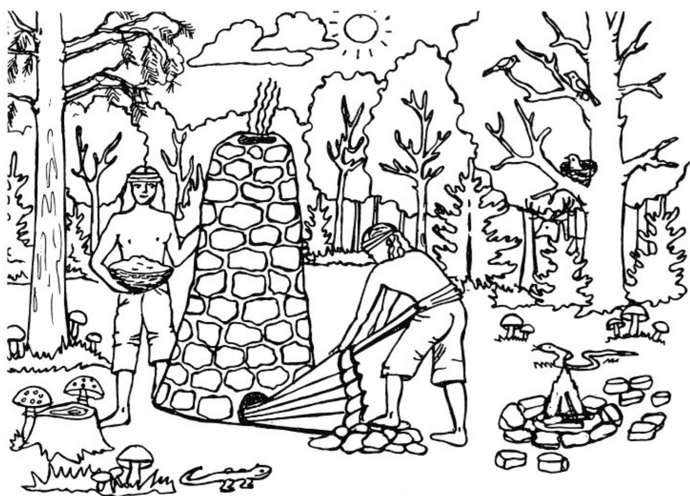
Na Budach w Rakszawie smolarze wypalali węgiel drzewny i wyrabiali dziegieć. Z kolei na Dymarce w piecach dymarskich wytapiano żelazo z rudy darniowej.